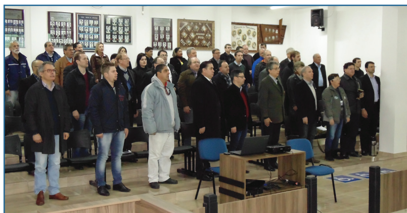
Emissoras prestigiaram o encontro de Chapada