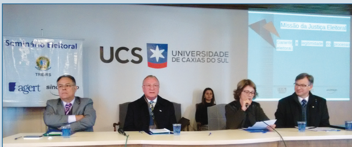
Evento em Caxias do Sul foi realizado na UCS