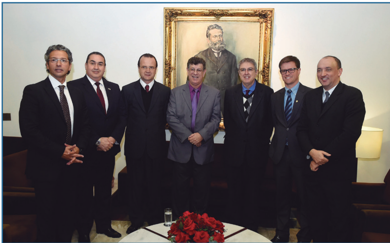
Emissora da fronteira oeste foi reconhecida pelo Legislativo Estadual