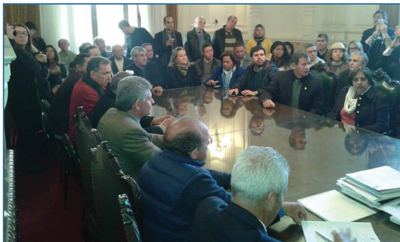
Mobilização da comunidade alegretense chegou ao Palácio Piratini

A união dos veículos de comunicação social de Alegrete é mais um exemplo do papel social desenvolvido pelos órgãos de imprensa, engajados na melhoria da qualidade de vida das comunidades onde atuam.