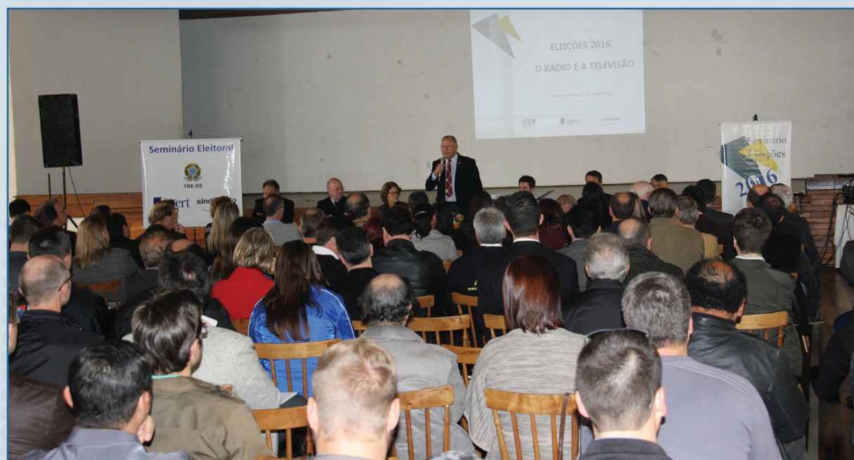
Seminário de Faxinal do Soturno teve grande presença de público

Para agosto, estão previstos mais dois encontros: Dia 04 de agosto, em Passo Fundo e dia 19 de agosto, em Santana do Livramento. Os radiodifusores de todas as regiões do Rio Grande do Sul estão convidados a participar dos seminários.